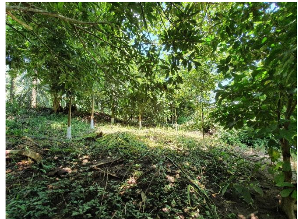
Figura 1. Crecimiento de árboles en Zona Ribereña