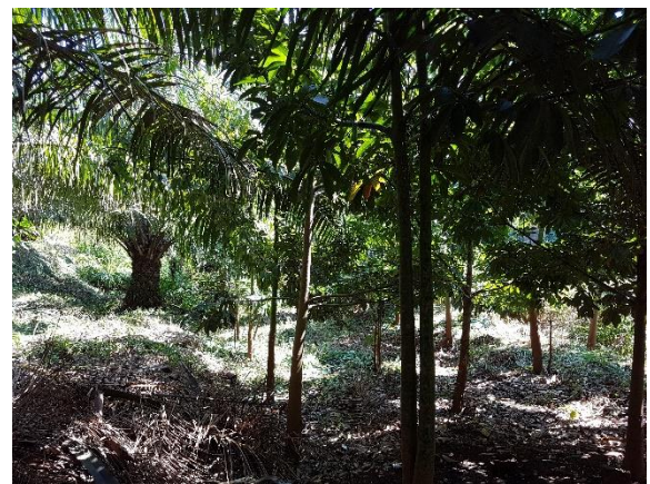
Figura 2. Mantenimiento a las zonas ribereñas.